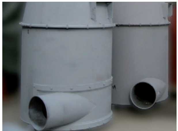
Abb. 4: Zyklonabscheider mit und ohne austauschbaren Aufprallbereich.