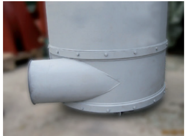
Abb. 3: HERBOLD Zyklonabscheider sind auch mit austauschbarem Aufprallbereich lieferbar!