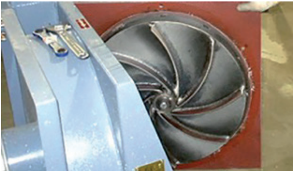
Abb. 7: Das Gebläserad hat gekrümmte Schaufeln, welche den Verschleiß verringern und unerwünschte Nachzerkleinerung der Materialien im Gebläse verhindert. Kann auch als EHST Serie aus Hochleistungsstahl geliefert werden.