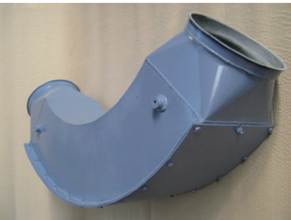
Abb. 2: Die Rohrbögen sind durch den austauschbaren Verschleißschutz wiederverwendbar .