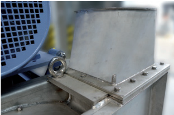
Abb. 6: ... sowie über austauschbare Saug- und Druckstutzen.