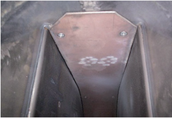
Abb. 5: Die Gebläse verfügen über eine austauschbare Verschleißeinlage ...