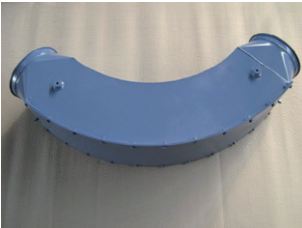
Abb. 1: HERBOLD verschleißfeste Rohrbogen sind durch den größeren Radius verschleißärmer als herkömmliche Rohrbogen.